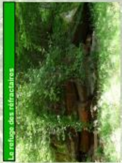
Le refuge des réfractaires