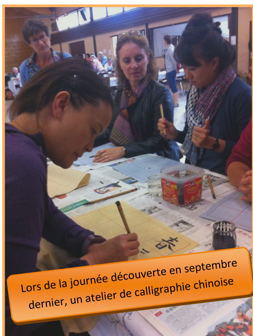
Lors de la journée découverte en septembre dernier, un atelier de calligraphie chinoise

Les activités proposées tiennent compte du niveau de chacun, des envies du groupe, de la saison et la météo, en accord avec le principe de la médecine chinoise.