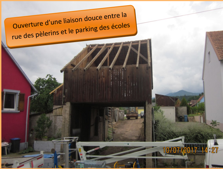
Ouverture d'une liaison douce entre la rue des pèlerins et le parking des écoles